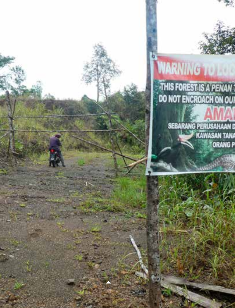
Les Penan de Long Tarum ont érigé un barrage contre le projet d'autoroute Pan-Borneo.