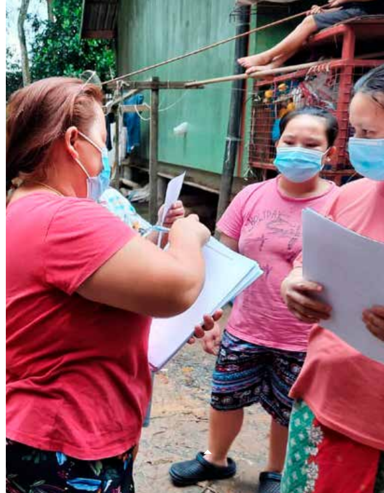
Une étude s'intéresse à la situation des jeunes Penan en ville.